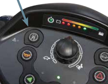
Selettore di riduzione della velocità

Comet Alpine ha un allestimento di tutto rispetto: sedile girevole, traslante ed estraibile tipo "Autostyle", regolabile in altezza con schienale inclinabile, braccioli allargabili e regolabili in altezza. Manubrio ergonomico con piantone inclinabile, freno a mano, cruscotto chiaro e completo con selettore di "riduzione automatica della velocità". Carenatura con parafanghi avvolgenti per proteggere le parti elettriche dall'acqua e dallo sporco.