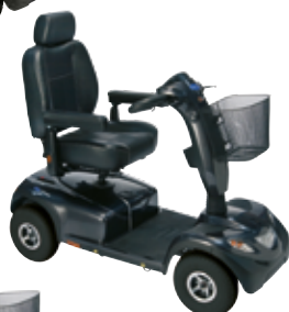
Invacare Comet Alpine