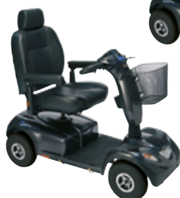
Invacare Comet HD