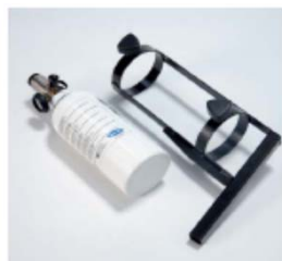
Porta bombola ossigeno